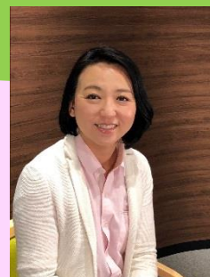
講師 株式会社ユメコム